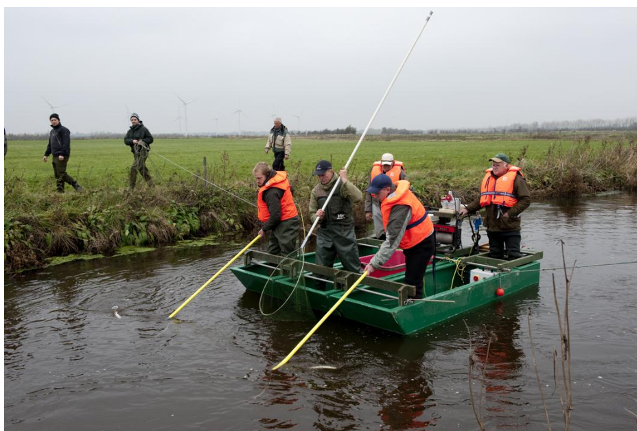
Elfiskekursus i Ribe Å

Der er planlagt afholdelse af et kursus i 2012, samt et genopfriskningskursus med særlig fokus på sikkerhed.