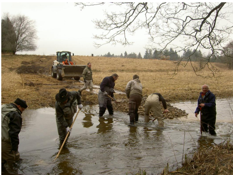
Grusudlægning i mindre vandløb

I 2011 var der i lighed med de 7 foregående år afsat en særlig pulje der kan søges af fiskeriforeningerne til mindre restaureringsprojekter – typisk gydegrusudlægning. Bevillinger fra puljen dækker kun materialeudgifter. Der indkom 28 ansøgninger, og der er fortsat god interesse for ordningen, der i 2011 er forhøjet til 500.000 kr. Det vurderes, at denne pulje er særdeles velegnet til at bringe de lokale fiskeriforeninger på banen i forhold til de kommunale forvaltninger