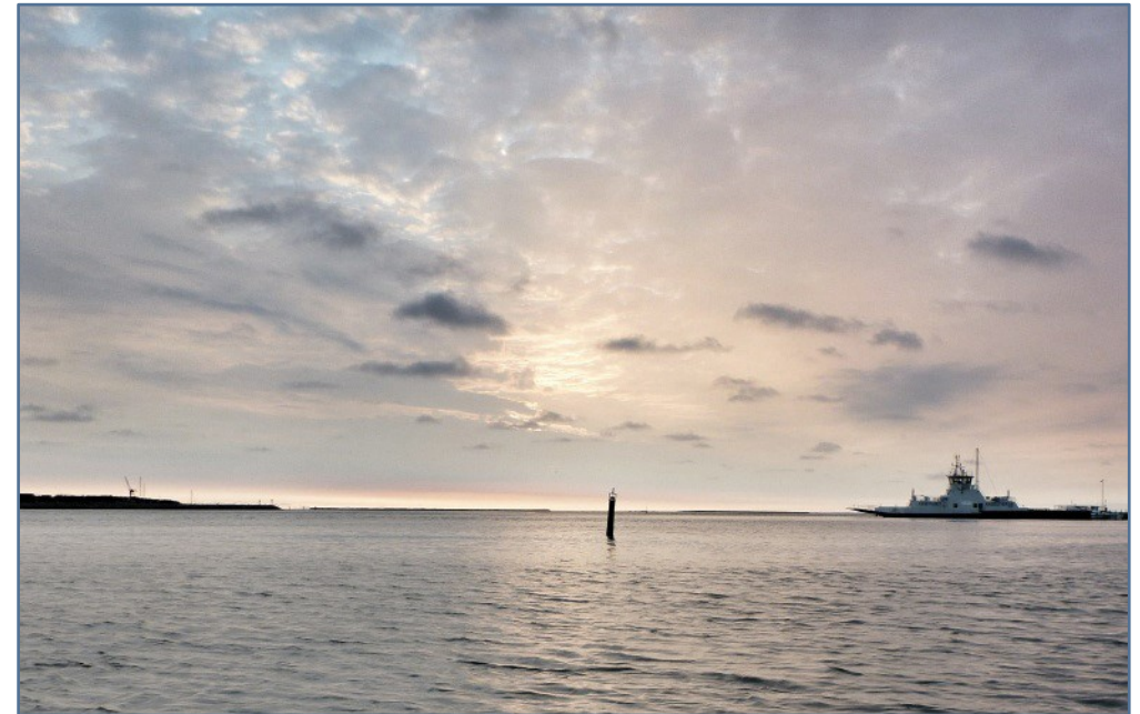
Folderen er blevet til i samarbejde med Randers Fjord Fritidsfiskerforening og Fiskeristyrelsen

Vær opmærksom på at den til enhver tid gældende fiskerilovgivning, også omfatter fiskeri i Randers Fjord!