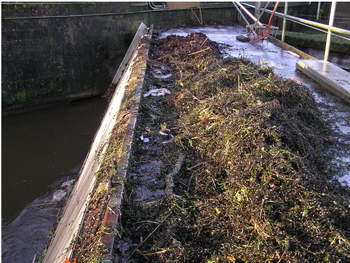
Figur 2. Vestbirk vandkraftanlæg. Ål fanget på gitteret og trukket op fra dette med den automatiske oprenser 15. december 2006.

Det er således observeret ved i hvert fald ét anlæg, at ål bliver fanget på gitteret hvor de antagelig omkommer, se foto figur 2. Driftspersonalet oplyser at dette kun observeres når anlægget kører for fuld belastning, altså når gennemstrømningen og dermed strømhastigheden er størst. Et forsigtigt skøn baseret på 2 observationsdage antyder at minimum omkring ¼ af ålene der søger at passere anlægget kan tabes på denne måde. Bortset fra denne observation er omfanget af dette problem ikke kendt.