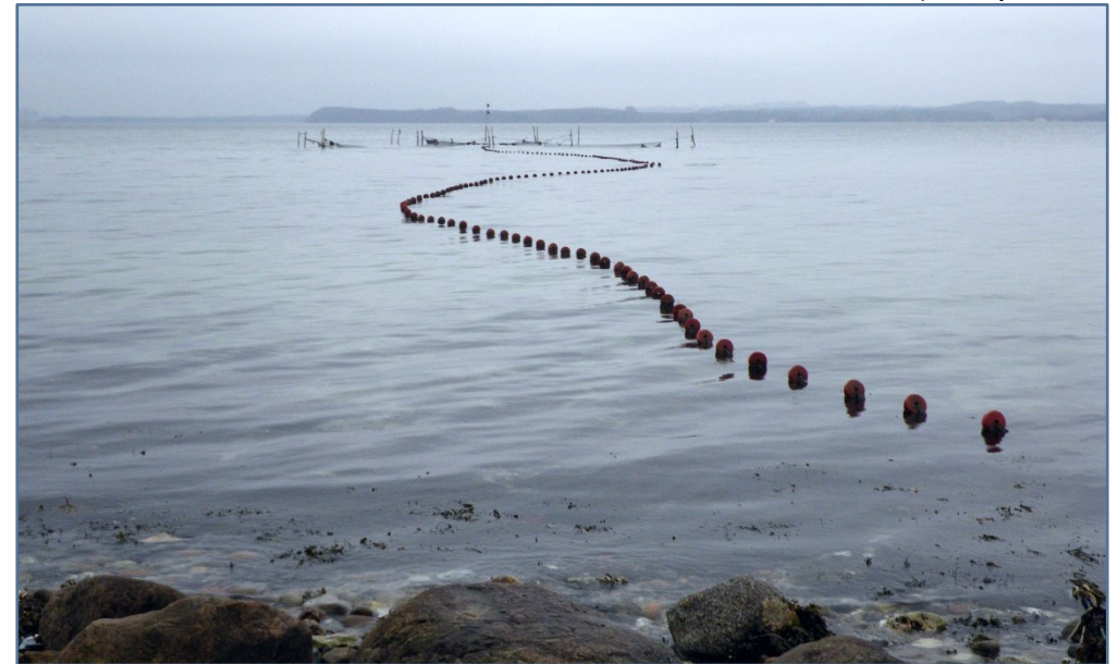
Folderen er produceret af Landbrugs- og Fiskeristyrelsen

Vær opmærksom på, at den til enhver tid gældende fiskerilovgivning, også omfatter fiskeri ved faststående redskaber.